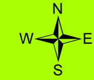
Tavola 7A Carta dei Vincoli