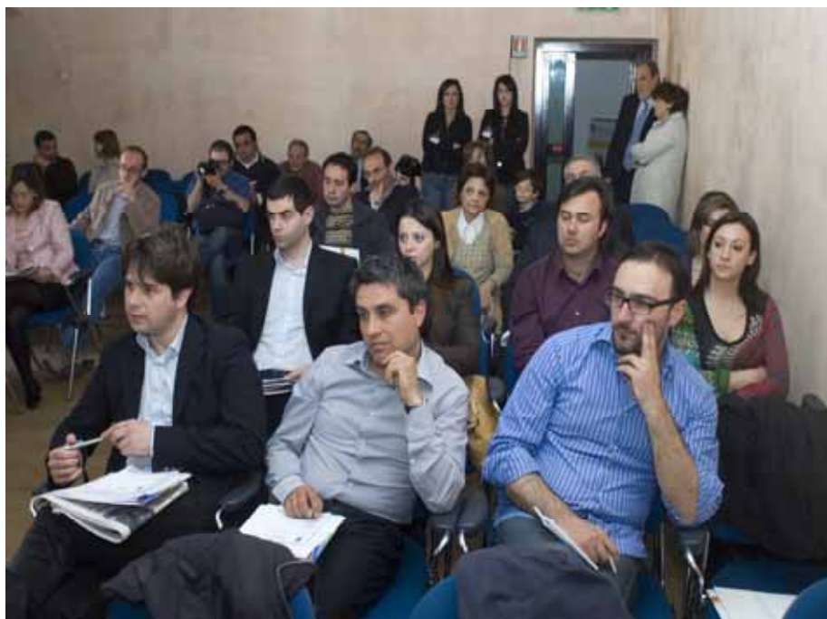
Fig. 4 - Il convegno "Giovani Eccellenze Lucane"