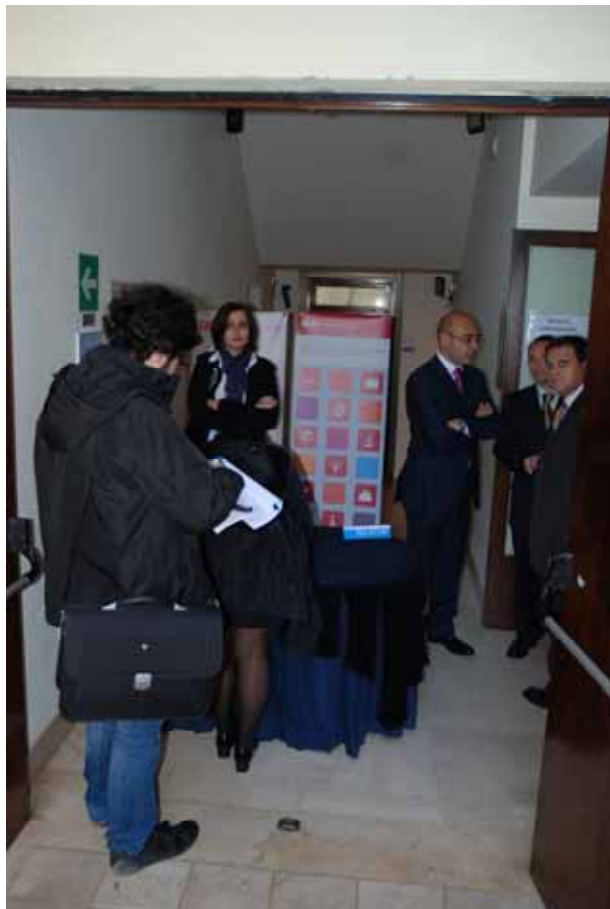
Fig. 10 - La registrazione dei partecipanti