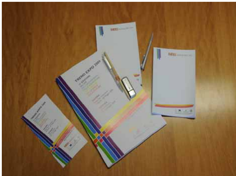
Fig. 2 - Materiale divulgativo