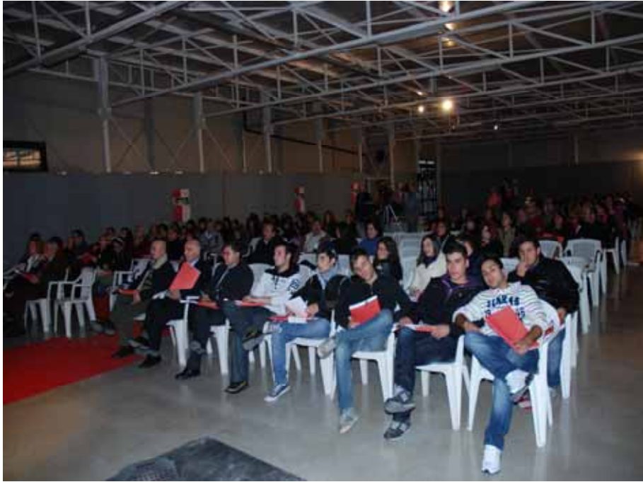
Fig. 21 - Un momento del Convegno