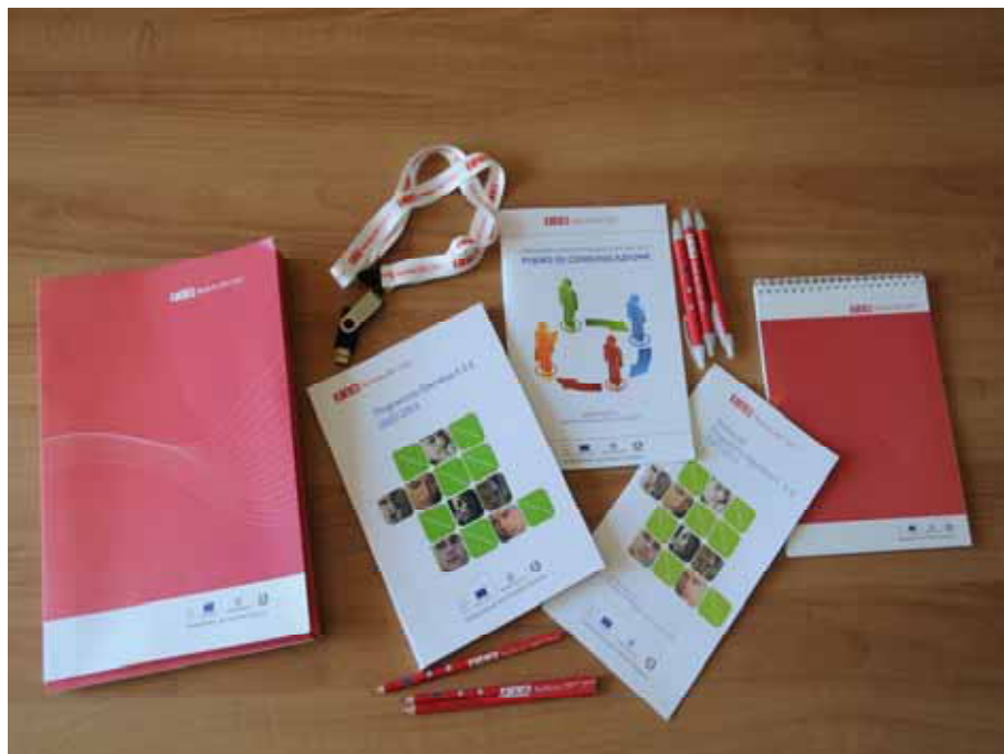
Fig. 8 - Materiale divulgativo