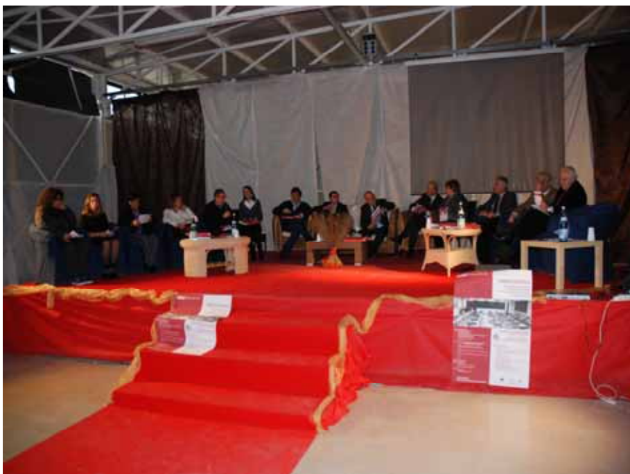
Fig. 22 - Un momento della Tavola Rotonda