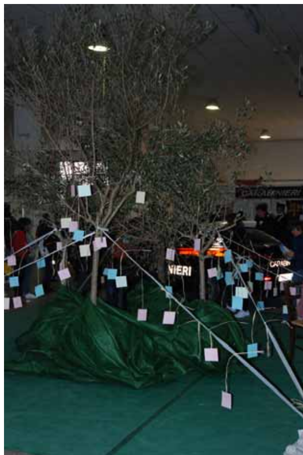
Fig. 20 - L'albero delle idee