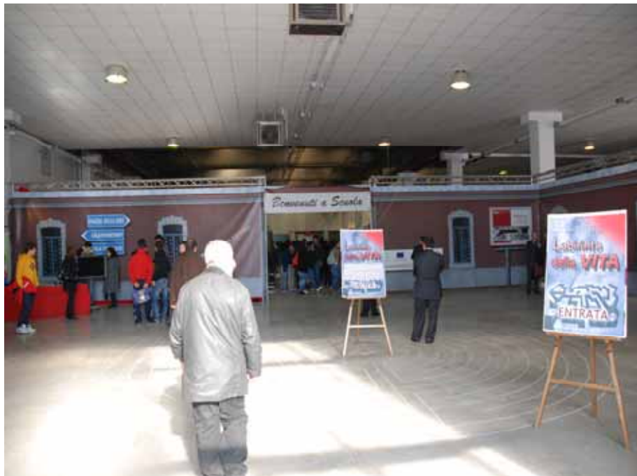
Fig. 13 - Ingresso del "Salone"