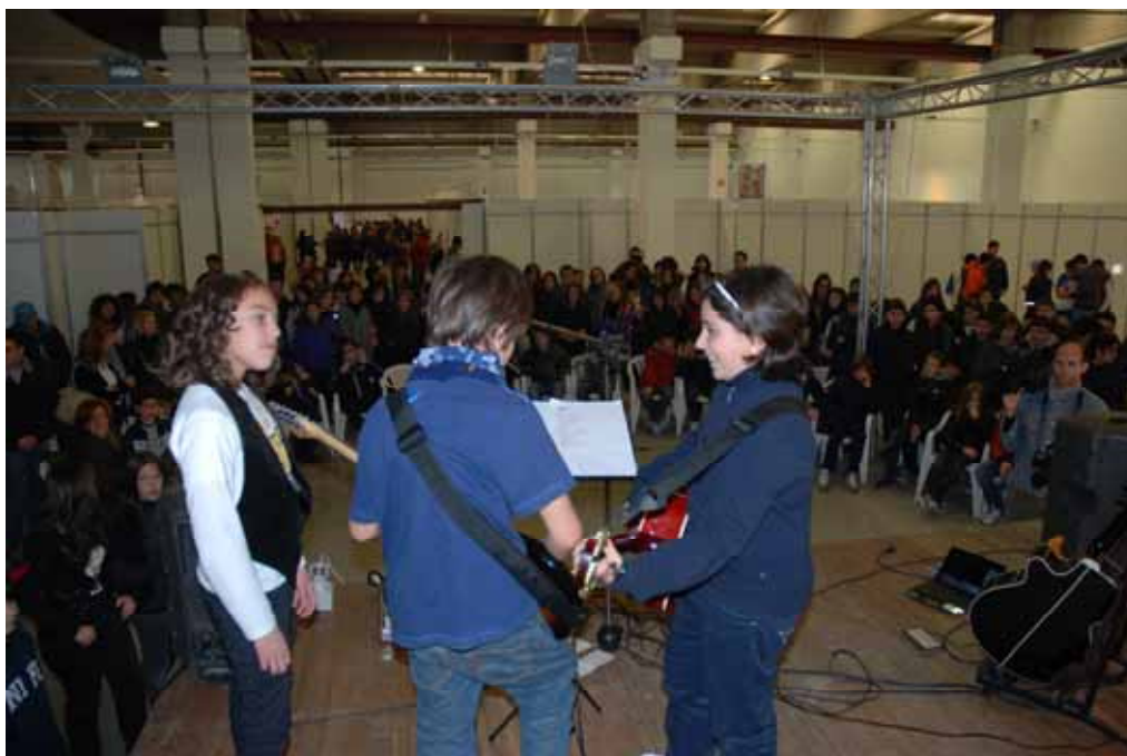
Fig. 18 - Laboratorio di musica