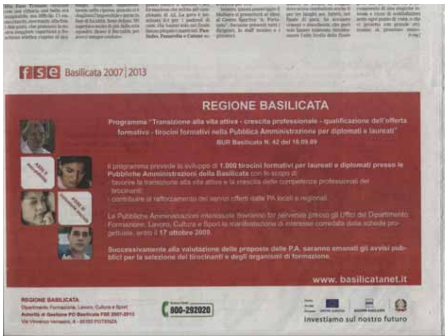
Fig. 27 - Pubblicità di un bando su un quotidiano