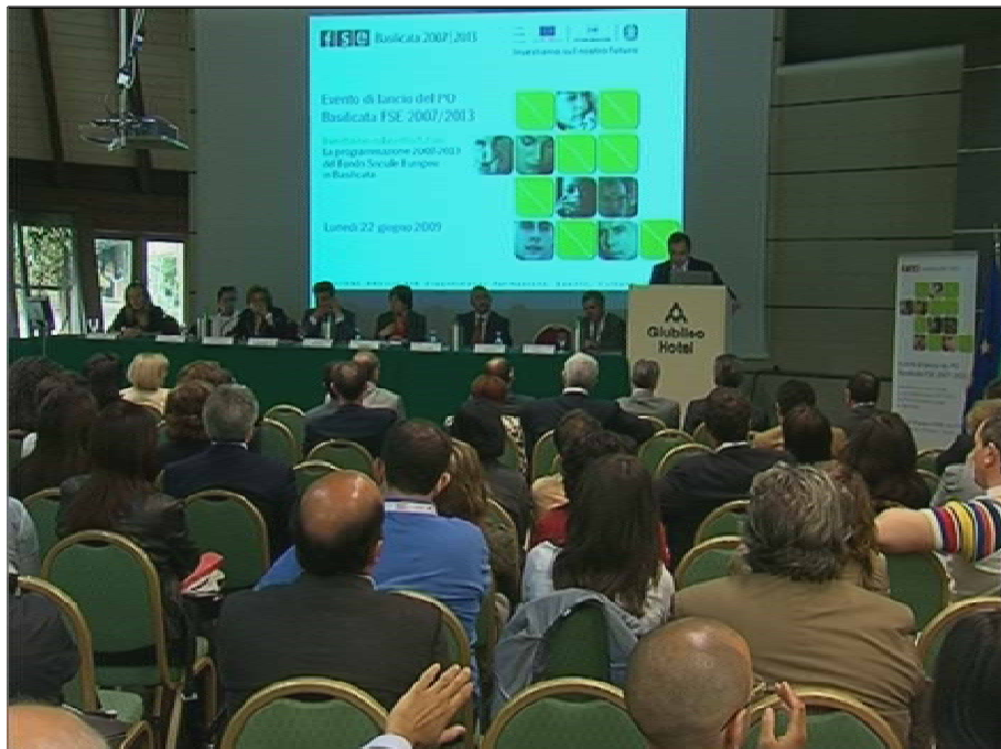
Fig. 7 - Un momento del Convegno