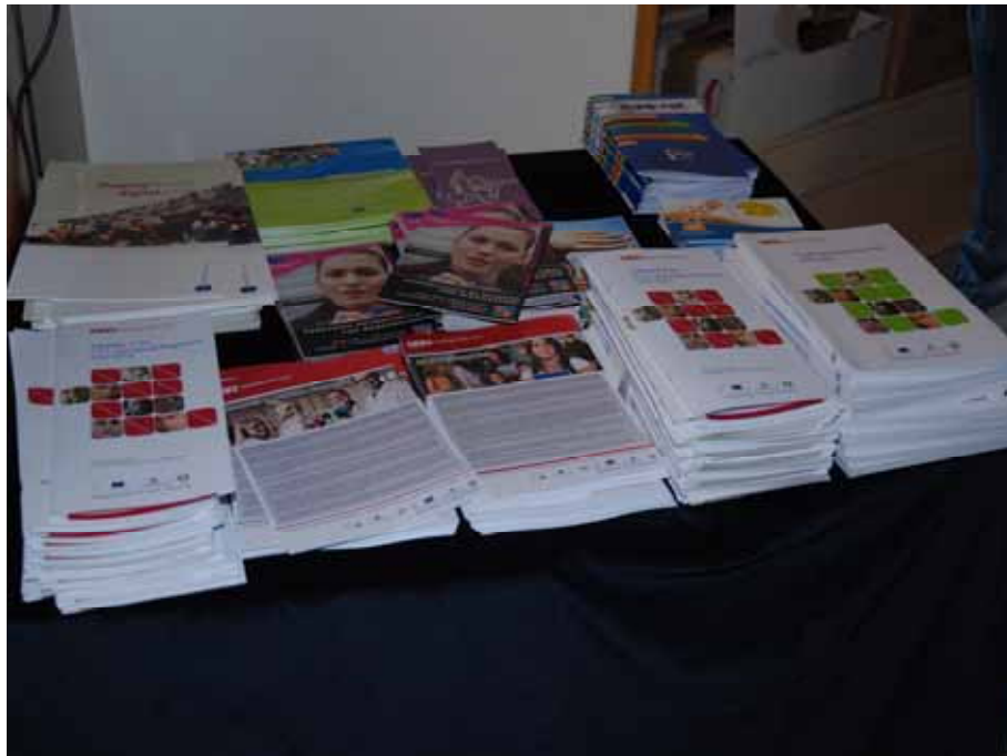
Fig. 11 - Materiale divulgativo