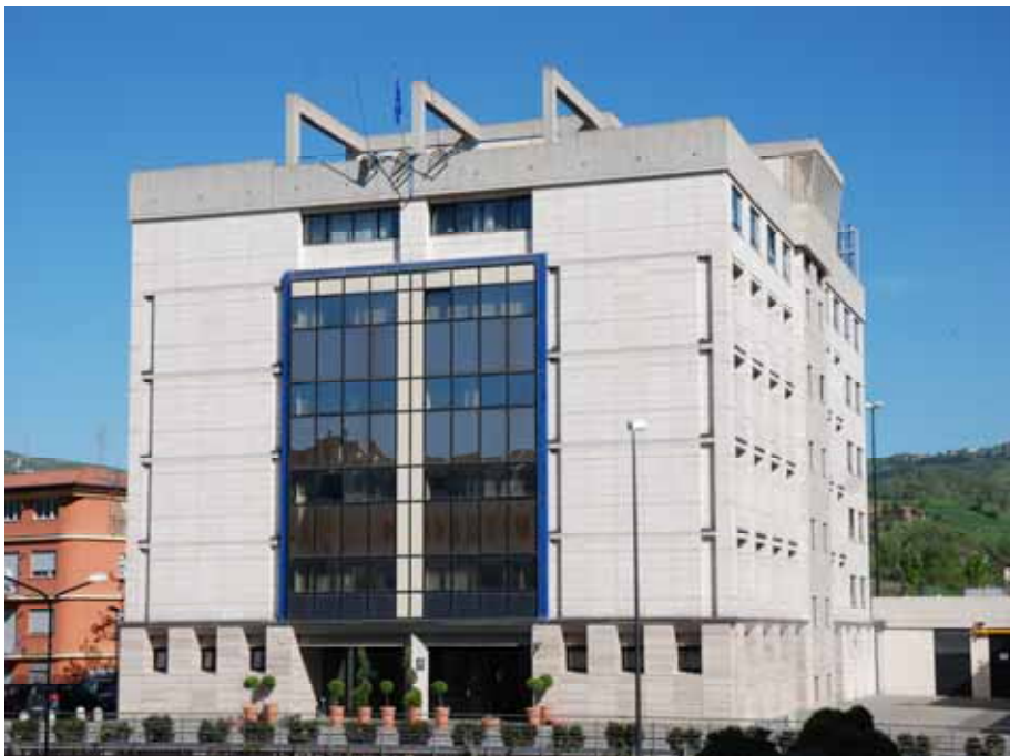
Fig. 6 - Sede dell'Autorità di Gestione FSE