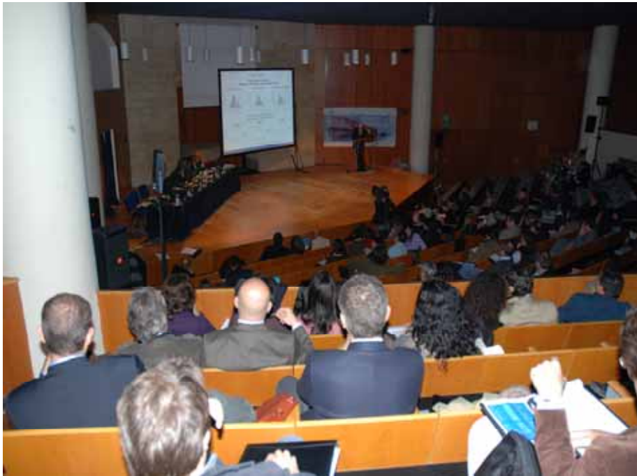
Fig. 9 - Un momento del Convegno