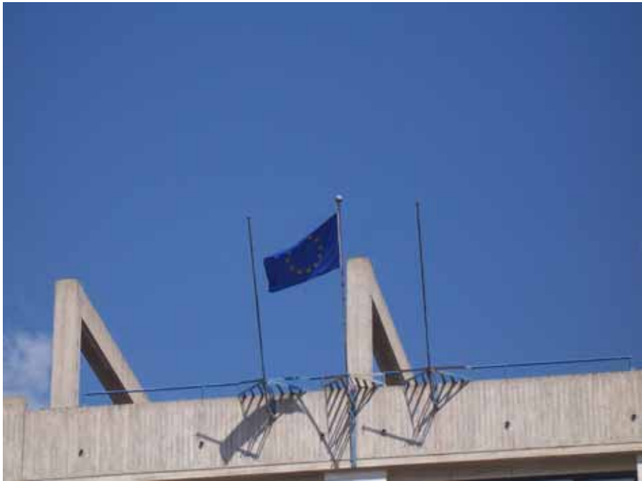
Fig. 5 - Esposizione della Bandiera