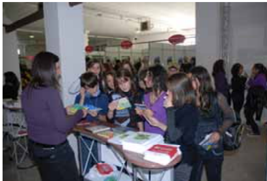
Fig. 16 - Distribuzione del materiale informativo