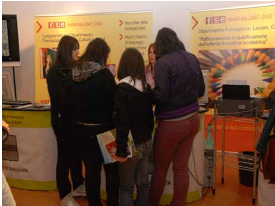
Fig. 1 - Stand espositivo