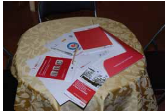
Fig. 17 - Cartella del Convegno