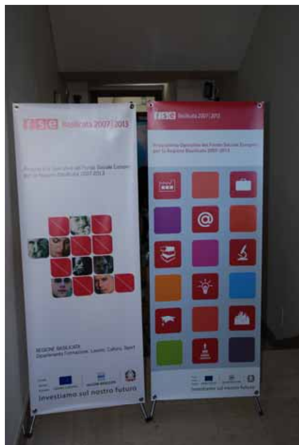
Fig. 12 - Totem