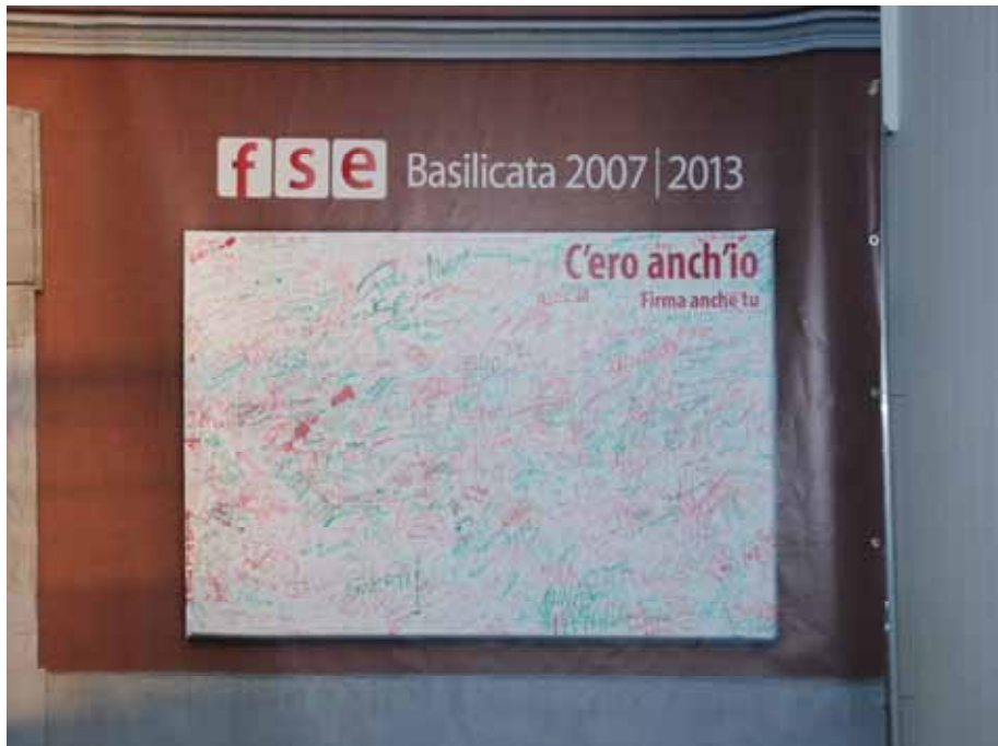
Fig. 19 - Pannello delle firme