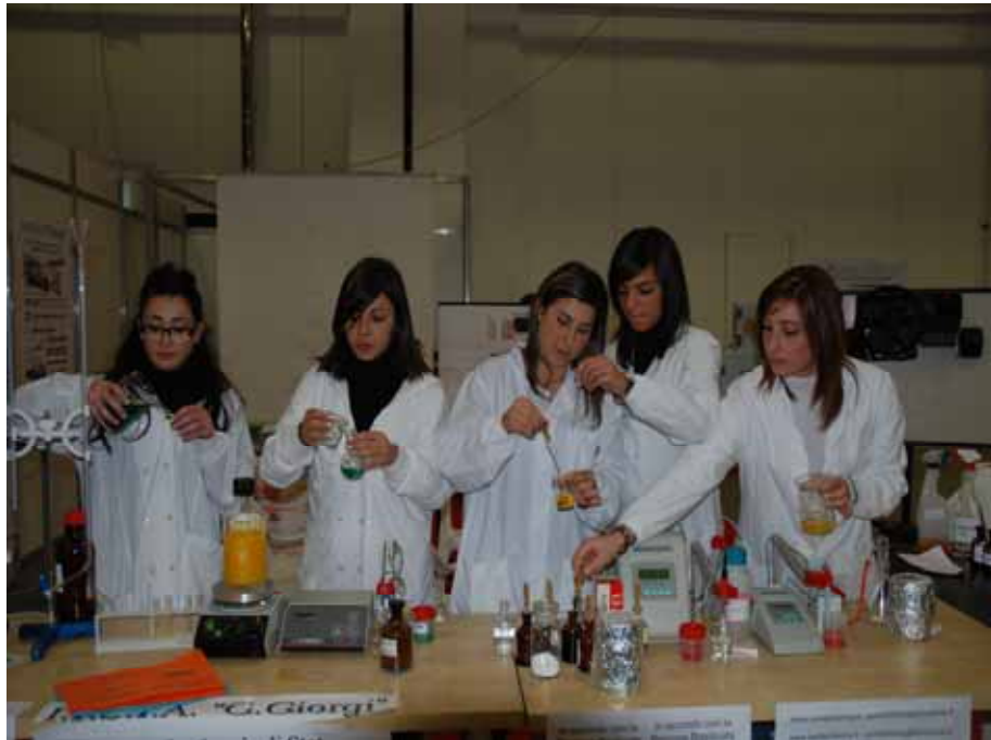
Fig. 15 - Uno degli stand espositivi curati dalle scuole