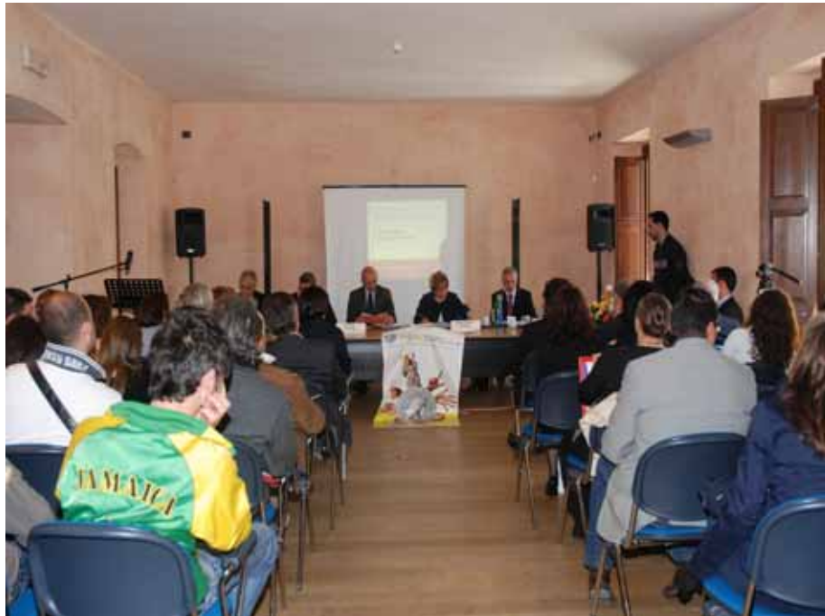
Fig. 3 - Un momento dei seminari