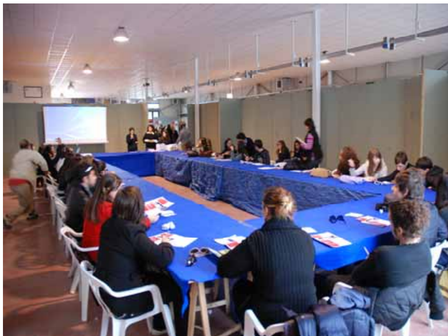
Fig. 14 - Un momento dei workshop